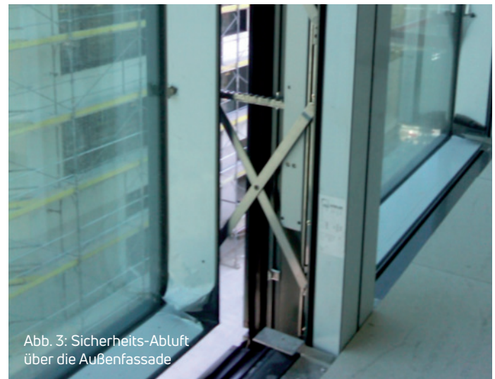
Abb. 3: Sicherheits-Abluft über die Außenfassade

Von der Brandmelderzentrale erhält das Differenzdrucksystem die Information, auf welcher Etage es brennt, öffnet nun in der Brandetage die relevanten Fenster zur Abströmung und gleichzeitig werden im gesamten Gebäude alle anderen Fenster geschlossen. Somit ist sichergestellt, dass in der