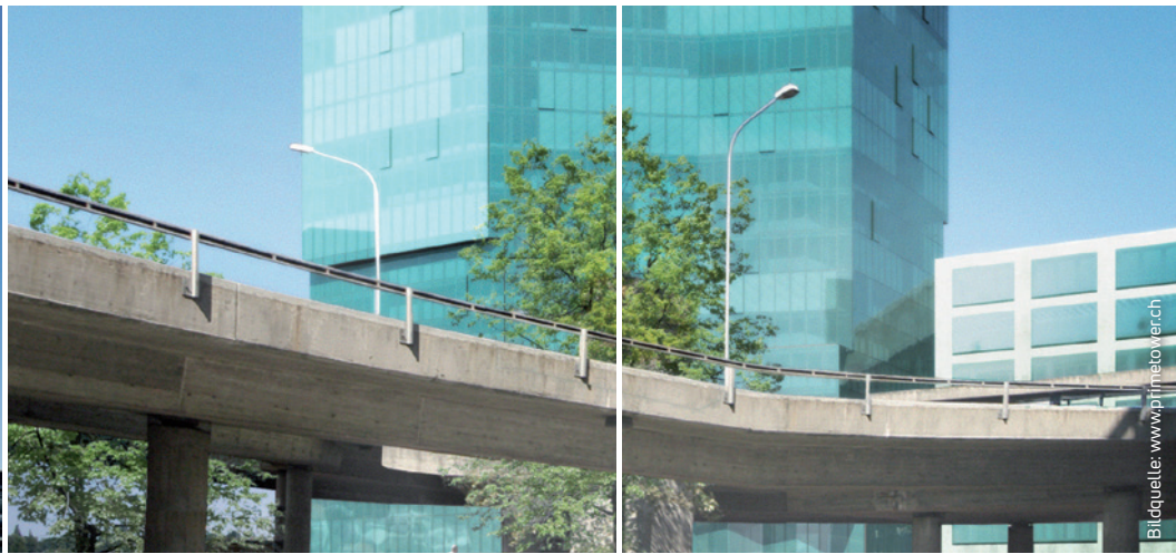
Prime Tower, Zürich