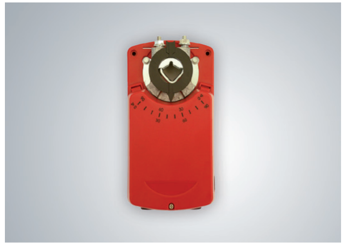
Abb. 5: Strulik-Zuluftklappenmotor mit 15 Stellungen

Es reicht zukünftig nicht mehr aus, bei der Auslegung eines Differenzdrucksystems nur den isothermen Zustand zu betrachten, sondern es muss auch der nicht isotherme Zustand berücksichtigt werden. Falls bei dieser Betrachtung festgestellt wird, dass es notwendig ist, Kompensationsmaßnahmen für den Sommer- und Winterfall durchzuführen, kann mit intelligenten Steuerungssystemen eine individuelle Anpassung vorgenommen werden und das geforderte Schutzziel „Rauchfreihaltung von Treppenhäusern“ unter allen klimatischen Bedingungen erfüllt werden.