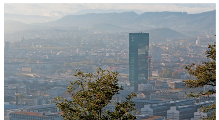
Abb. 2: Blick auf Zürich mit Prime Tower

Das Differenzdrucksystem im Prime Tower wurde nach DIN EN 12101-6 Festlegung für Differenzdrucksysteme geplant. Dabei gilt die Regelzeit für das Differenzdrucksystem beim Öffnen und Schließen der Türen im Treppenhaus von 3 Sekunden. Diese Zeit muss zwingend eingehalten werden.