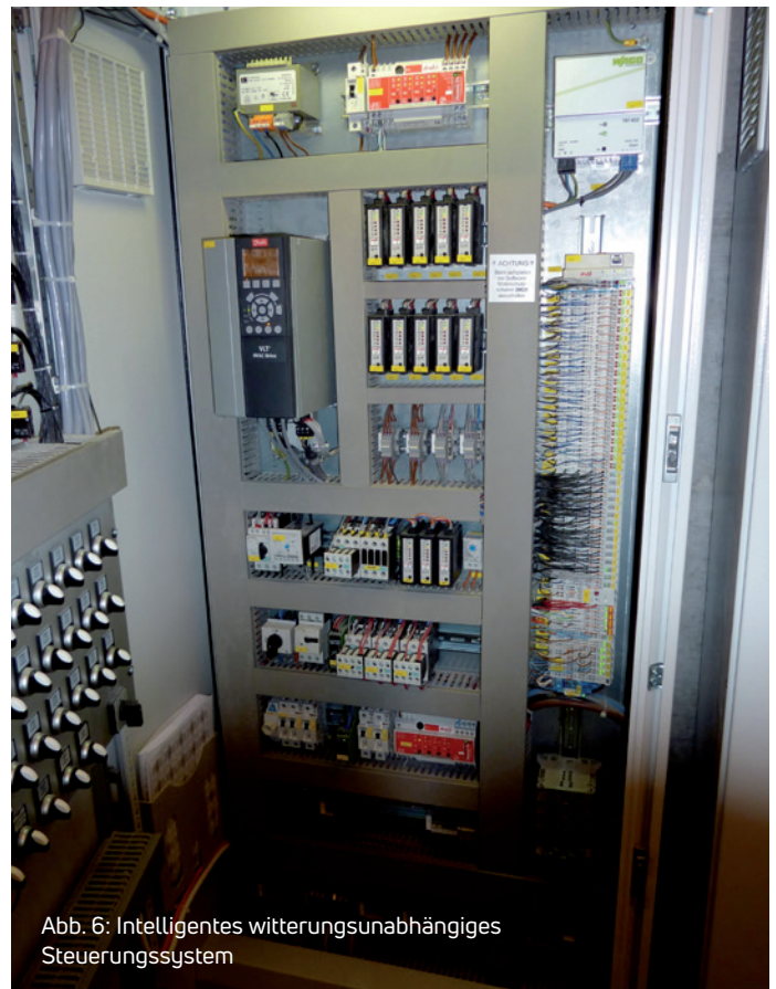
Abb. 6: Intelligentes witterungsunabhängiges Steuerungssystem